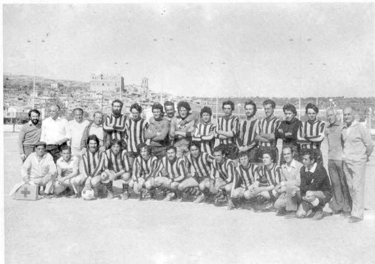
C. F. VALDERROBRES