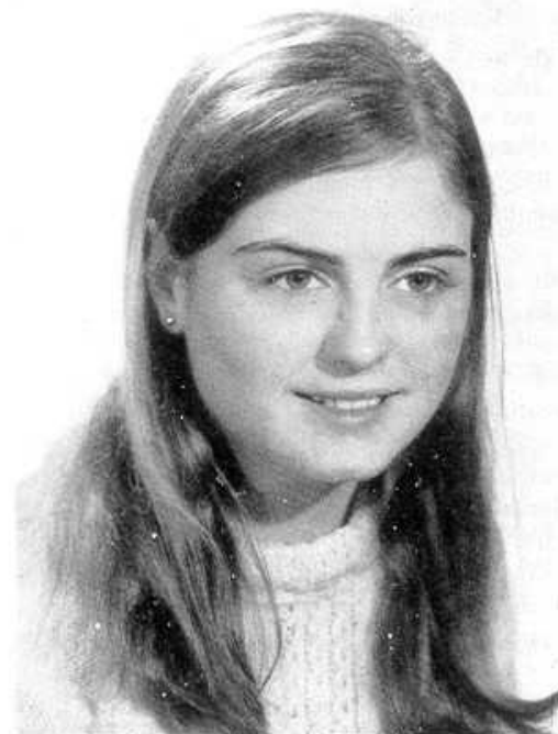
Pubilla de las Fiestas

Se aproxima el momento de la partida. Nos acostamos temprano, pues mañana salimos a las cuatro de la madrugada. Tenemos preparado el equipaje. Durante las horas que hemos permanecido en la cama, apenas hemos podido conciliar el sueño, nuestro pensamiento ha ido dando vueltas, representándonos el trayecto que nos disponemos a recorrer salpicado de ilusiones. Una vez acomodados en el vehículo, conversamos con nuestros compañeros de viaje y nuestra conversación recae sobre todo hechos y anécdotas que habíamos vivido; pero por más que queremos disimular, nuestra voz delata nuestra emoción. Comentamos todos los hechos y ocurrencias, con tanta claridad como si hubiera ocurrido ayer. Aquel amigo que en las pedreas era el más valiente, aquel otro que no retrocedía nunca y tenía la pebradrada segura; el que era un hábil jugador a las bolas, al idem, el churrónillo: 'Churro media manga mandanguera'. El juego a los pistoleros era la mar de divertido y muy movido en nuestras correrías. Llegábamos a la Cuesta del Muro por los TERRES y la viña de FOZ y también al PUIG y al MUN DE SANTO.