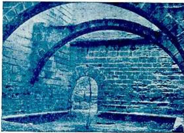
Un interior del Castillo