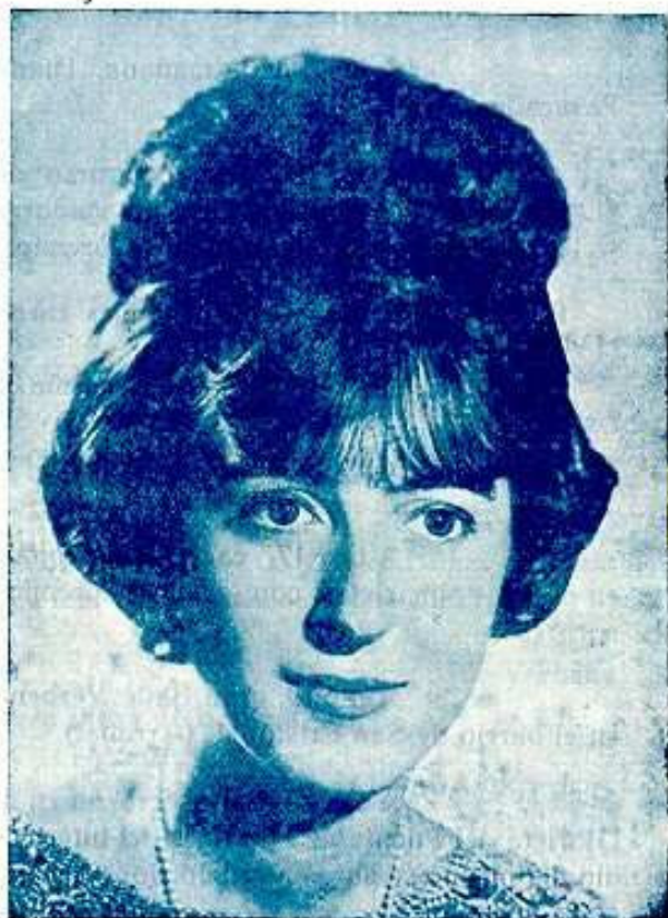
REINA DE LAS FIESTAS DE LA COLONIA CATALANA 1964