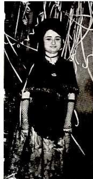
REINA DE LAS FIESTAS 1965