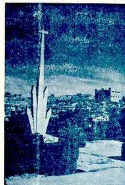
Cruz de los Caidos