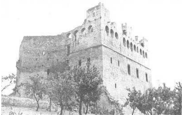
«El castillo, en las horas de sol, brilla desde lejos como si fuera de alabastro.» (Azorín)

El castillo de Valderrobres es uno de esos palacio-fortaleza que sucedieron a los castillos típicamente castreños, a medida que el señorío feudal trocaba su rudeza primitiva por los refinamientos que la civilización iba aportando en el transcurso del tiempo. Es de estilo gótico; pero un gótico que corresponde a un momento de tránsito espiritual, cuando ya la sociedad medieval se sentía capaz de grandes empresas, ardiendo en deseos de perfeccionar hasta el máximo la edificación, como exponente más genuino de una época.