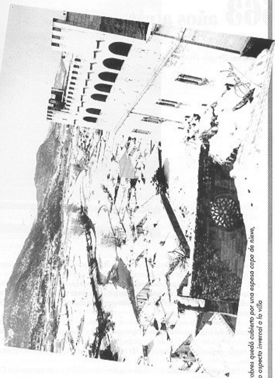
1992 : Valderrobres quedó cubierto por una espesa capa de nieve, dando un bonito aspecto invernal a la villa